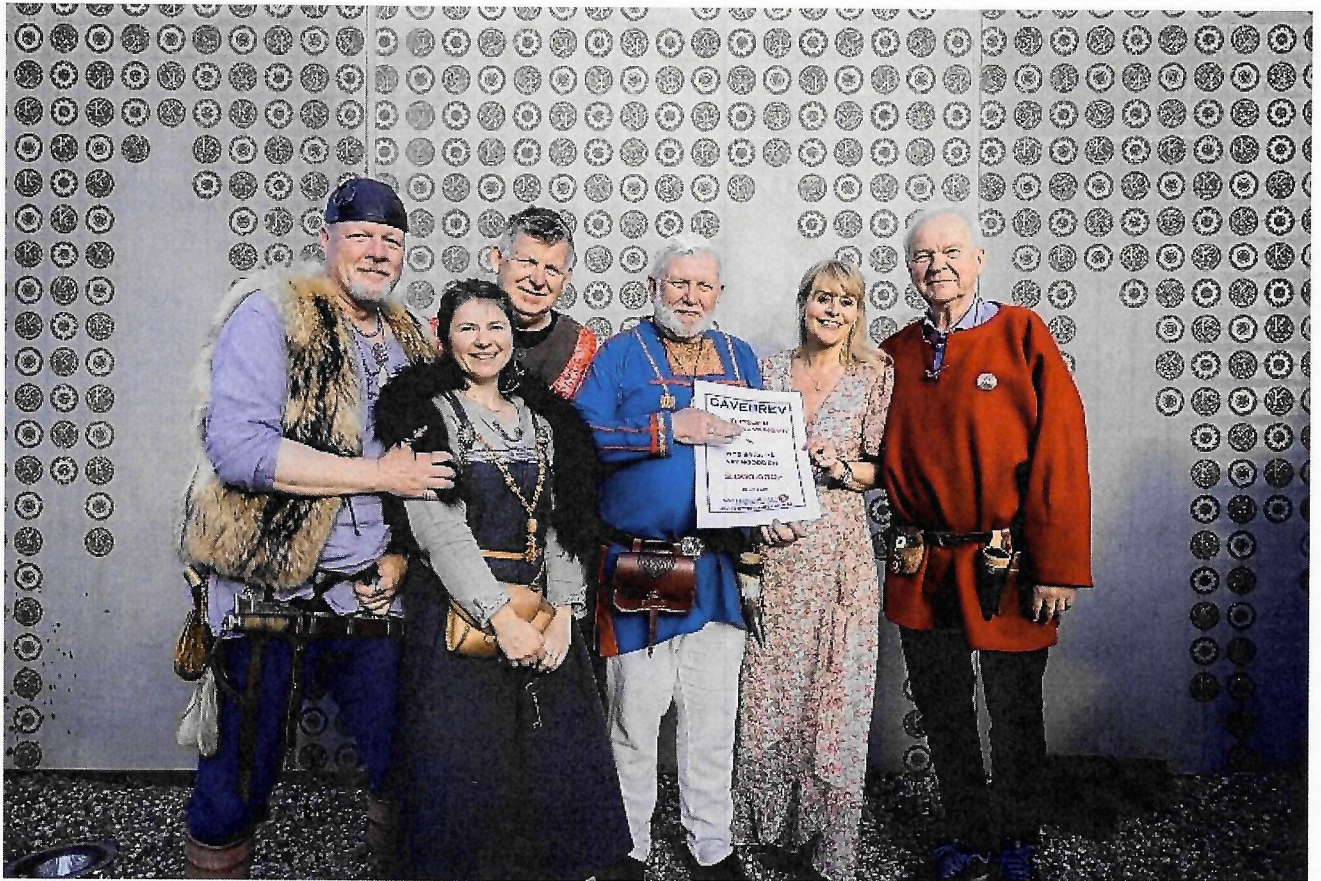
Stiftelsen Oseberg Vikingarv fikk 3 millioner kroner til to nye bygg på Vikingodden.