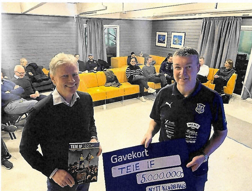
Teie Idrettsforening fikk 5 millioner kroner til nytt klubbhus.