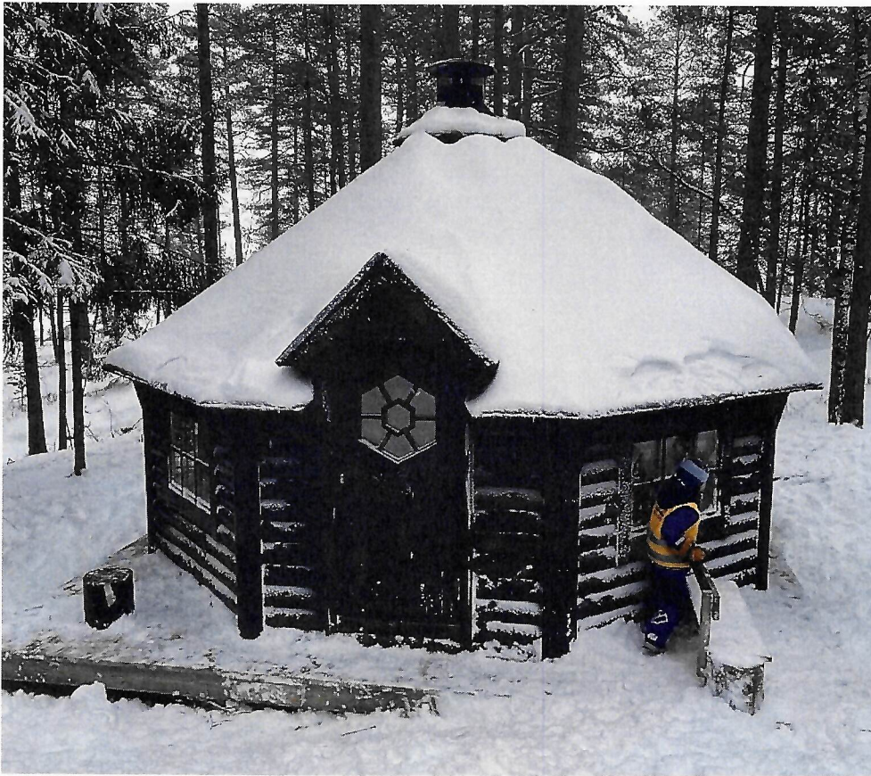
Teiehøyden Barnehage fikk 200 000 kroner til ny grillhytte i Teieskogen.