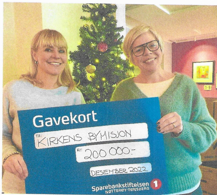
«Jul i en kasse» til utsatte familier før jul