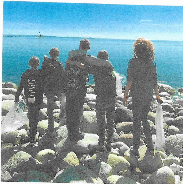
Plastinnsamling langs kysten, Ren Skjærgård 2022