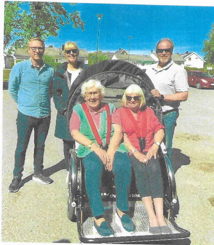
Mobilitetsstøtte for eldre